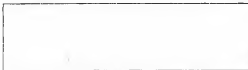
Схема границы балансовой принадлежности

е) границей эксплуатационной ответственности объектов централизованной системы холодного водоснабжения Гарантирующей организации и заказчика является: