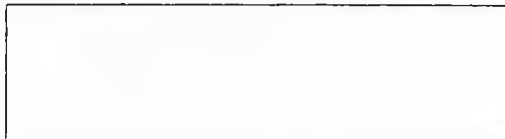
Схема границы эксплуатационной ответственности